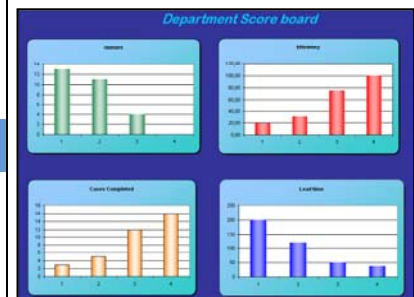
Graferne i Excel regnearket (den engelske version)